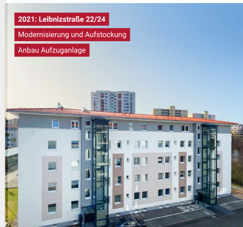
2021: Leibnizstraße 22/24 Modernisierung und Aufstockung Anbau Aufzugsanlage