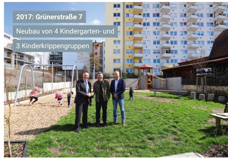
2017: Grünerstraße 7 Neubau von 4 Kindergarten- und 3 Kinderkrippengruppen