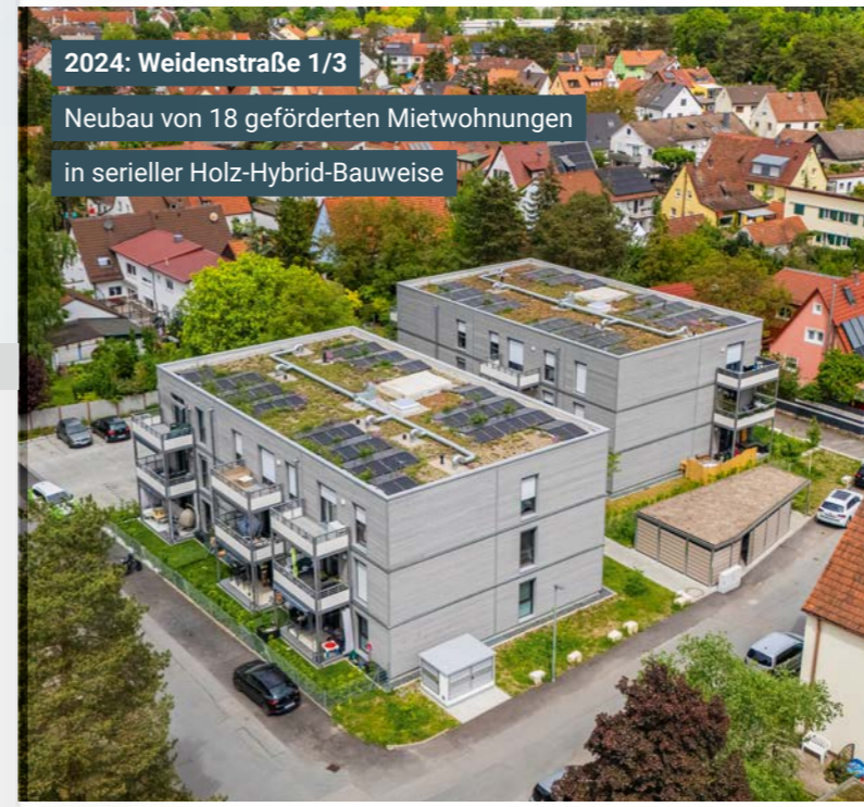
2024: Weidenstraße 1/3 Neubau von 18 geförderten Mietwohnungen in serieller Holz-Hybrid-Bauweise