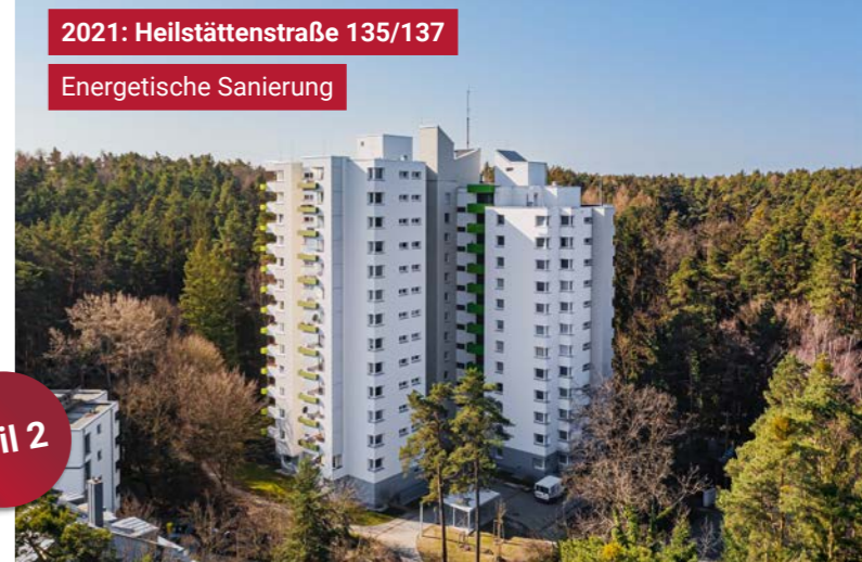
2021: Heilstättenstraße 135/137 Energetische Sanierung