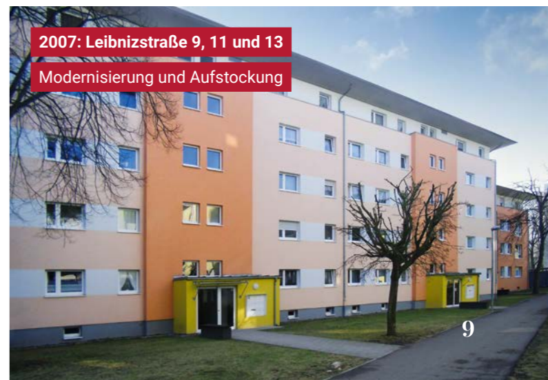
2007: Leibnizstraße 9, 11 und 13 Modernisierung und Aufstockung