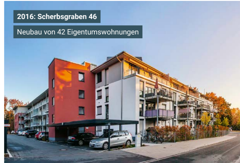
2016: Scherbsgraben 46 Neubau von 42 Eigentumswohnungen