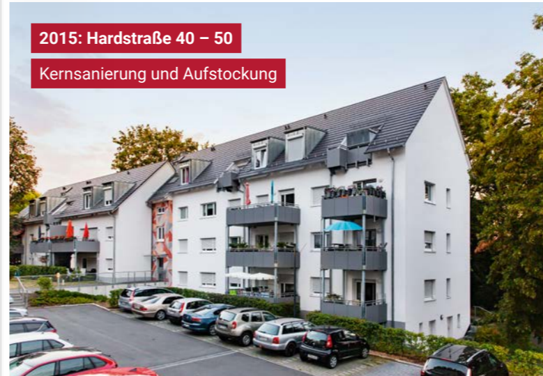
2015: Hardstraße 40 – 50 Kernsanierung und Aufstockung