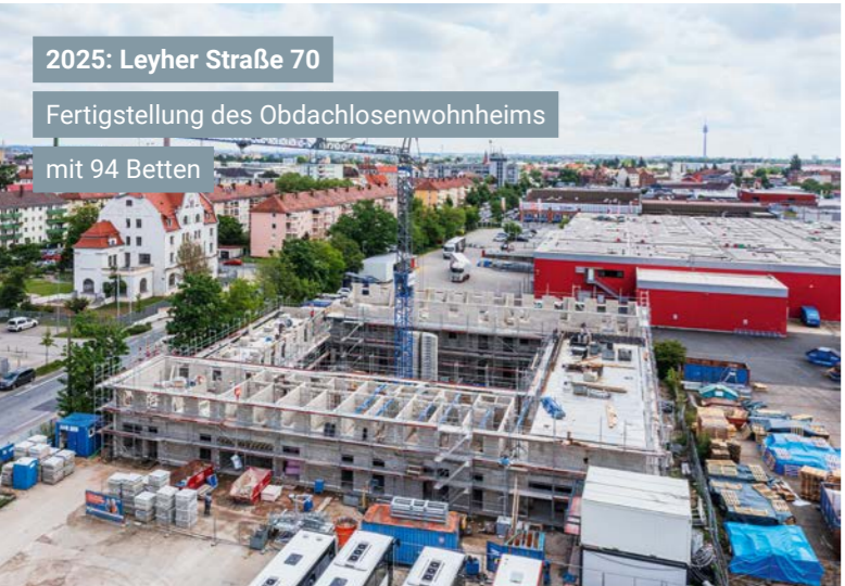
2025: Leyher Straße 70 Fertigstellung des Obdachlosenwohnheims mit 94 Betten