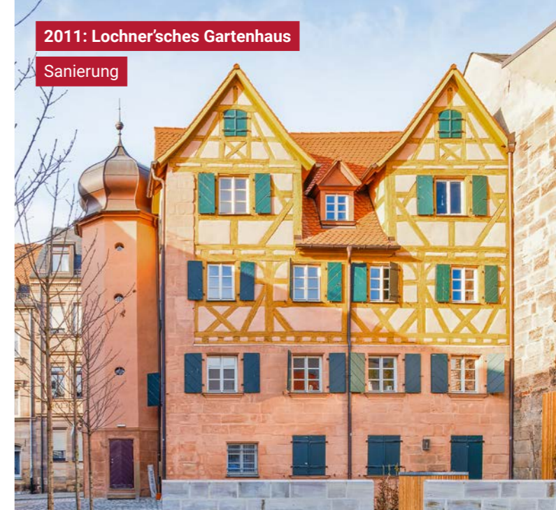
2011: Lochner'sches Gartenhaus Sanierung