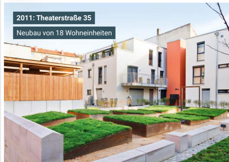
2011: Theaterstraße 35 Neubau von 18 Wohneinheiten