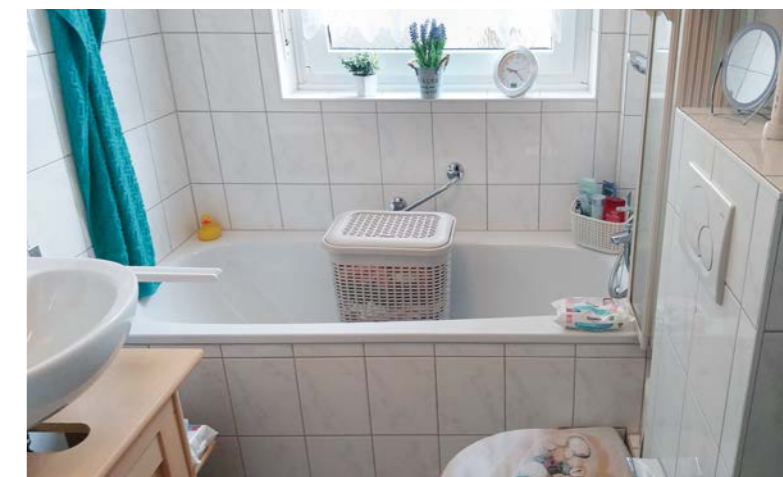
Bilder oben: Die neue altersgerechte Dusche mit Glastür, Familie Sobieraj und Herr Hörl (WBG) freuen sich über die gewonnene Bewegungsfreiheit. Bild unten: Das Bad vor dem Umbau mit Badewanne.