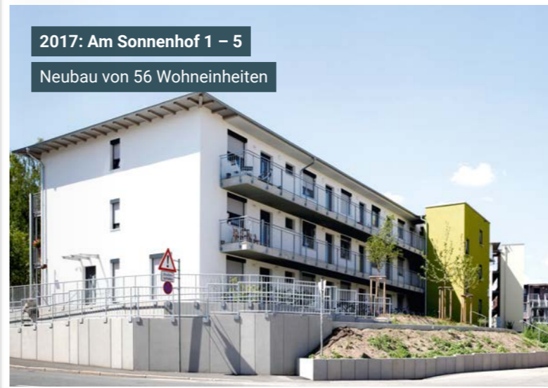
2017: Am Sonnenhof 1 – 5 Neubau von 56 Wohneinheiten