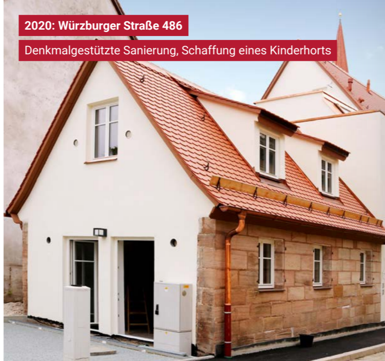
2020: Würzburger Straße 486 Denkmalgestützte Sanierung, Schaffung eines Kinderhorts