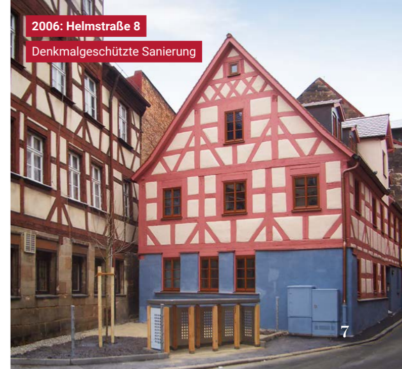
2006: Helmstraße 8 Denkmalgeschützte Sanierung