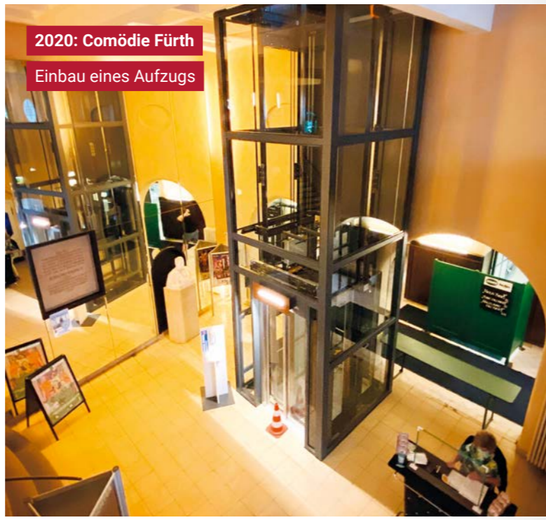
2020: Comödie Fürth Einbau eines Aufzugs