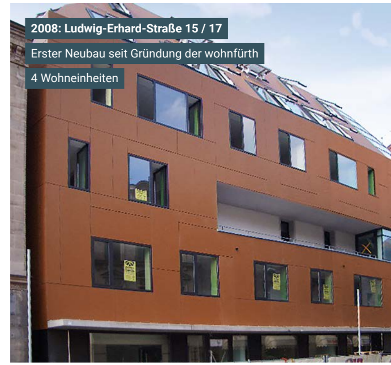
2008: Ludwig-Erhard-Straße 15 / 17 Erster Neubau seit Gründung der wohnfürth 4 Wohneinheiten