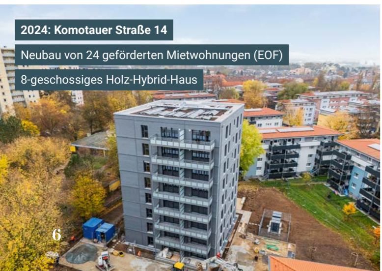
2024: Komotauer Straße 14 Neubau von 24 geförderten Mietwohnungen (EOF) 8-geschossiges Holz-Hybrid-Haus