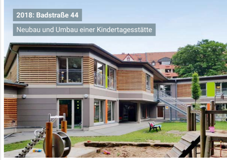
2018: Badstraße 44 Neubau und Umbau einer Kindertagesstätte