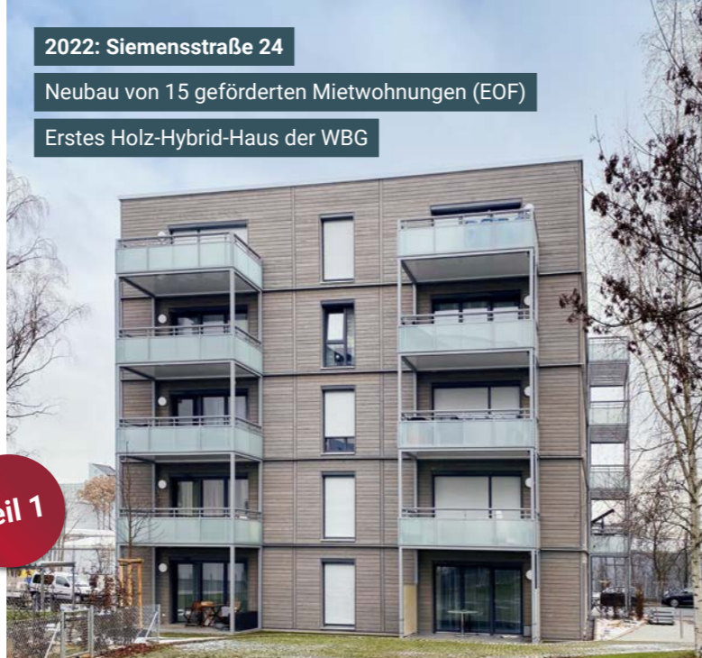
2022: Siemensstraße 24 Neubau von 15 geförderten Mietwohnungen (EOF) Erstes Holz-Hybrid-Haus der WBG