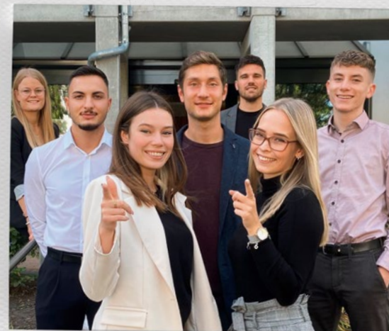
DIE WBG FÜRTH AUSZUBILDENDEN & IHRE AUSBILDER:INNEN

Mit unseren vier Partnern, der wohnfürth, König Ludwig Stiftung, Soziales Wohnen und WBG Fürth Land stehen wir für fairen, sozialen und nachhaltigen Wohnraum in Fürth.